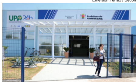
Emerson Ferraz / Secom