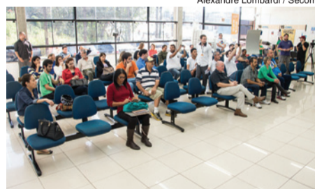
Alexandre Lombardi / Secom