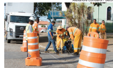
Alexandre Lombardi / Secom