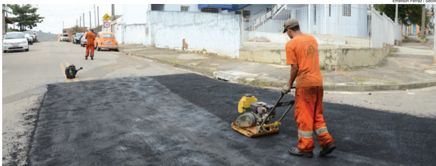
Emerson Ferraz / Secom

Confira a relação de ruas atendidas pela operação Tapa-Buraco nesta semana: