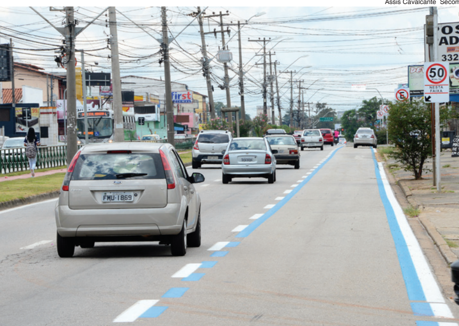
Assis Cavalcante Secom

Com essa nova faixa, Sorocaba passará a ter quatro faixas exclusivas: nas Ruas Comendador Oeterer e Hermelino Matarazzo e nas Avenidas General Carneiro e Itavuvu, totalizando catorze quilômetros de extensão.