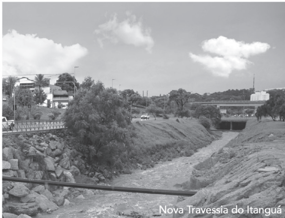
Nova Travessia do Itanguá

Por isso, está trabalhando com força total para realizar muitas melhorias.