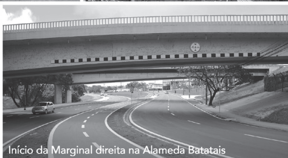
Início da Marginal direita na Alameda Batatais

A Travessia do Itanguá acabou com os alagamentos na região da Américo Figueiredo e Adão Pereira de Camargo. O Início da Marginal direita , na Alameda Batatais, melhorou o fluxo do trânsito. O Viaduto Humberto de Campos trouxe mais mobilidade e as Novas Academias ao Ar Livre, Ciclovias e Praças , mais qualidade de vida para toda a cidade. Além do Parque Flamboyant , com mais lazer para a Zona Norte.