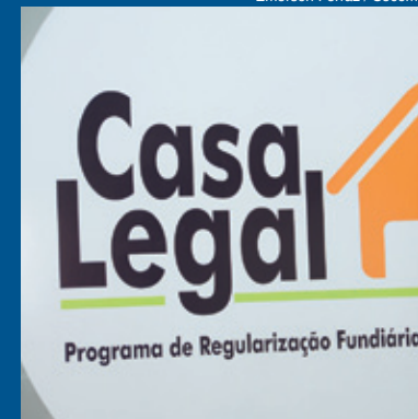
Emerson Ferraz / Secom

Mais de 250 famílias recebem no próximo dia 25 os títulos de registro de imóvel com base na regularização fundiária promovida pela Prefeitura de Sorocaba, por intermédio da Secretaria da Habitação e Regularização Fundiária (Sehab). A solenidade marcada para as 19h, no Teatro Municipal "Teotônio Vilela", se traduz na última etapa do trabalho da pasta para assegurar legitimidade de posse de áreas ocupadas de forma irregular.