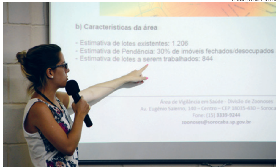
Emerson Ferraz / Secom

A delimitação das áreas das três regiões que serão atendidas no Dia "D" foi definida pela Divisão de Zoonoses da SES com base no maior número de casos suspeitos, ou confirmados, dessas doenças ligadas ao Aedes. No Sol Nascente/Monterrey há elevado número de notificações de dengue. No Paineiras, além disso,