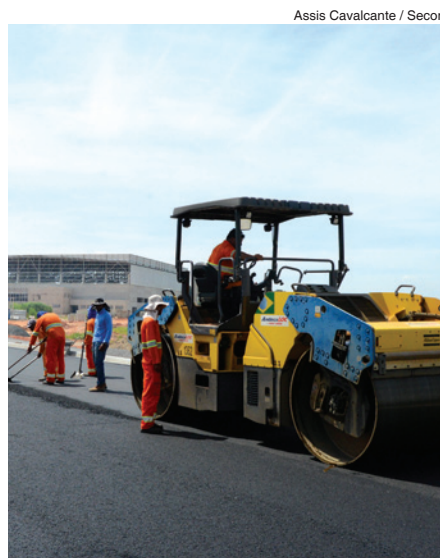
Assis Cavalcante / Secom

Além do pavimento, as pistas terão paisagismo que envolverá o plantio de grama, calçada e sistema de iluminação pública com postes de aço de doze metros de altura. Também está prevista a implantação de sinalização horizontal e aplicação de tachões refletivos, além de serviços de infraestrutura para drenagem (guia, sarjeta e boca de lobo).