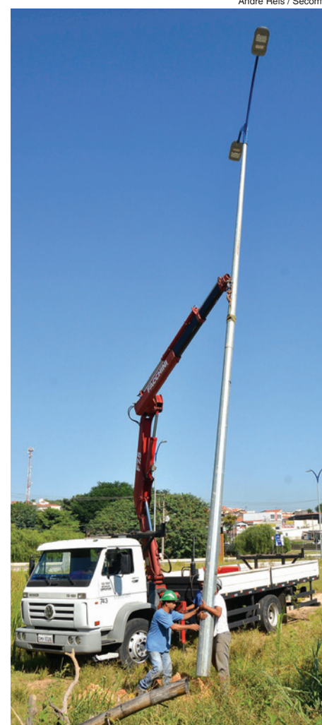
André Reis / Secom

No Parque das Águas, a troca das 416 lâmpadas de vapor de sódio por lâmpadas LED já foi concluída. A melhoria integra o Programa de Eficiência Energética da empresa, desenvolvido com participação da Agência Nacional de Energia Elétrica (Aneel).