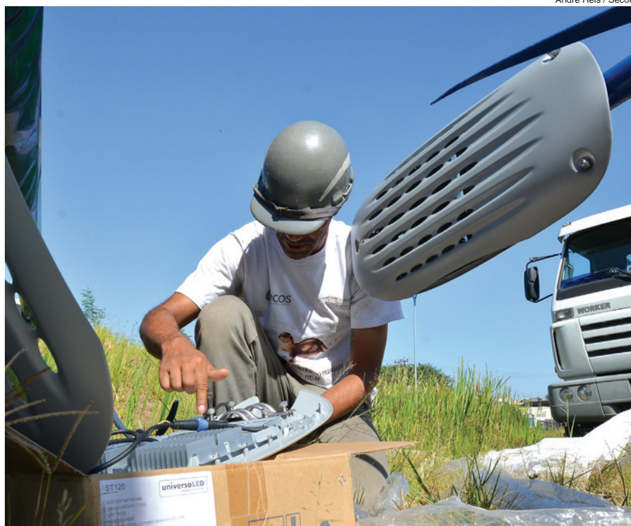
André Reis / Secom

A implantação deste tipo de iluminação na Praça, resultado