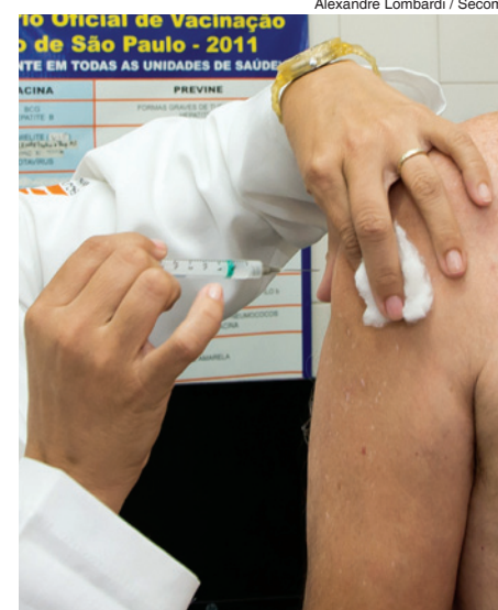
Alexandre Lombardi / Secom

A SES faz o cadastramento do público a ser vacinado em hospitais, clínicas, asilos e presídios. No Dia "D" haverá ainda uma equipe volante para atendimento aos assistidos pelo Serviço de Atendimento Domiciliar (SAD). A previsão é que Sorocaba receba 150 mil doses do Ministério da Saúde, para proteger a população contra os vírus A/California (H1N1), A/Hong Kong (H3N2) e B/Brisbane. A campanha vai até 20 de maio.