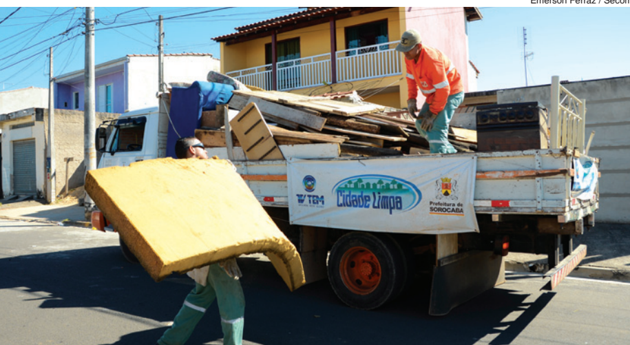
Emerson Ferraz / Secom