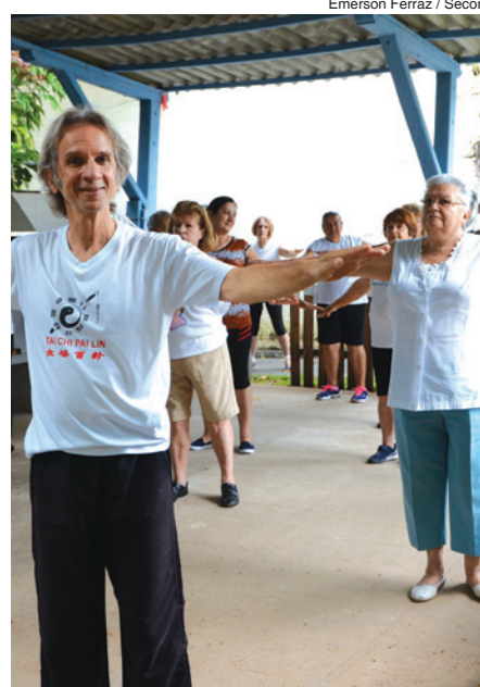
Emerson Ferraz / Secom

As inscrições devem ser feitas de segunda a sexta-feira, das 8h às 17h, na própria unidade. A Chácara do Idoso fica na Rua Manuel Afonso, 64, na Vila Progresso. Mais informações pelo telefone (15) 3302.3737.