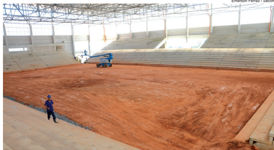
Emerson Ferraz / Secom

A Arena Multiúso terá capacidade para 5 mil pessoas e a obra tem valor estimado em R$ 16,7 milhões. A previsão de entrega é para junho, caso não haja interferências climáticas. Uma das pistas acesso está pronta e serão utilizadas também para entrada no novo Hospital Regional, em construção pelo Governo do Estado.