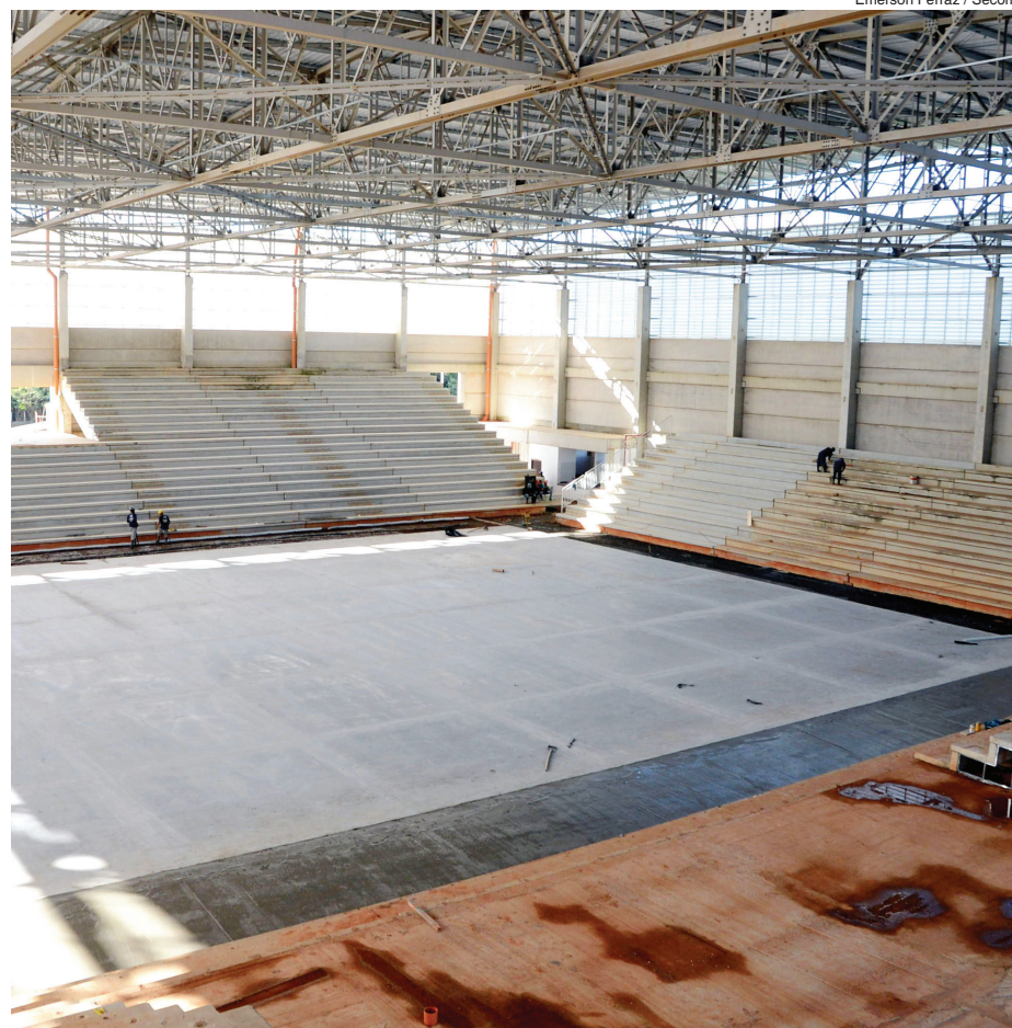
Emerson Ferraz / Secom

De acordo com a Secretaria de Mobilidade, Desenvolvimento Urbano e Obras (Semob), o piso da quadra ainda receberá cobertura emborrachada. Com medidas oficiais de esportes – como futsal, handebol, basquete e vôlei – a Arena Multiúso ainda servirá como palco para apresentações culturais e artísticas. A administração do espaço será da Secretaria de Esporte e Lazer (Semes). A construção da Arena tem seu valor estimado em R$ 16,7 milhões e a previsão de entrega do novo espaço poliesportivo é junho deste ano.