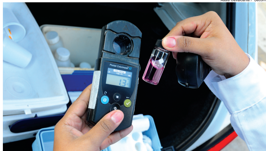
Assis Cavalcante / Secom

As coletas nos bairros são às quartas-feiras. A cidade foi dividida em 10 regiões - cada uma com 11 pontos de monitoramento - sendo que a cada semana a Visa visita uma delas. Um técnico do Saae acompanha o serviço e colhe amostra para análise paralela. A Visa verifica a temperatura e o pH da água; o teor de cloro é medido pelo Saae. As amostras da Visa são enviadas ao Instituto