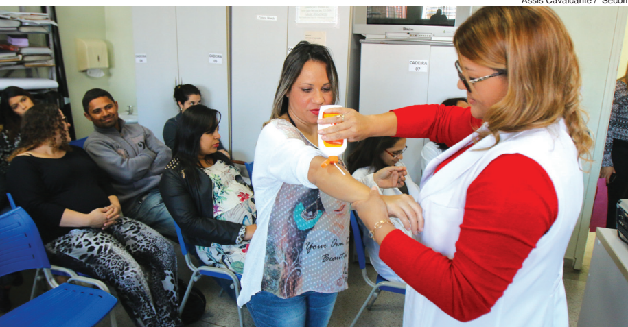
Assis Cavalcante / Secom

Segundo a DVE, além do controle para se evitar criadouros dentro de casa, as grávidas precisam usar repelente. Também é recomendado que vistam blusas de manga comprida e calças compridas. A Divisão de Zoonoses mantém as visitas domiciliares, os arastões e nebulizações em bairros para conscientizar a população e eliminar criadouros do mosquito Aedes aegypti .