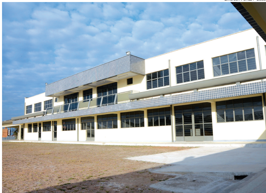
Emerson Ferraz / Secom

A área a ser ocupada é de aproximadamente 1,5 mil m 2 e a