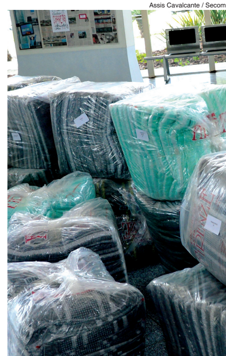
Assis Cavalcante / Secom