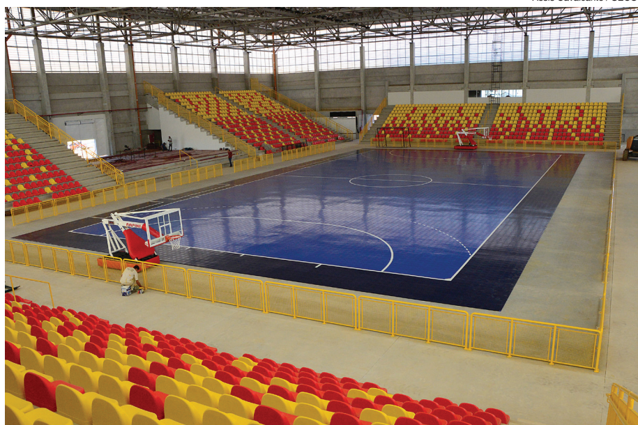
Assis Cavalcante / SECOM

da Rodovia Raposo Tavares, no sentido interior capital, a Arena Multiúso terá capacidade para 4 mil lugares, dos quais 18 são reservados para cadeirantes e