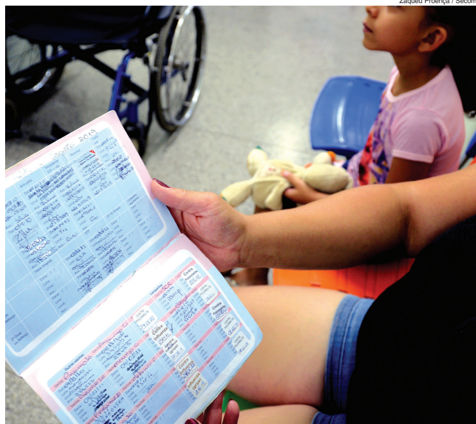
Zaqueu Prouença / Secom

A DVE ressalta a importância de as crianças e adolescentes serem levados às UBSs de referência, próximas às respectivas residências, portando o cartão de vacinação. Só assim o profissional da unidade poderá avaliar e verificar a necessidade de vacina, caso haja algum atraso.