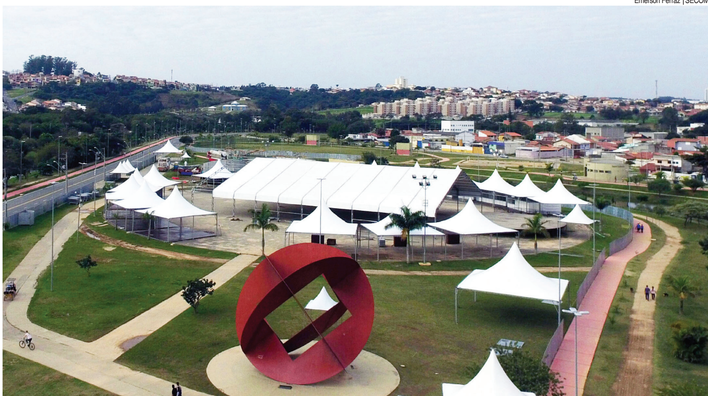
Estrutura está sendo montada no Parque das Águas

O evento terá ainda shows com artistas de renome nacional como Simone e Simaria (30/06), Pedro Paulo e Alex (2/07), Jorge e Mateus (6/07), Turma do Pagode (9/07) e Wesley Safadão