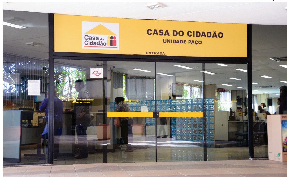
Espaço de atendimento auxilia nas demandas dos cidadãos

Entre as atividades que serão desenvolvidas no local, destacam-se: Emissão de certidões e tributos fiscais; IPTU; ISS; Solicitação de transporte especial ou ambulância; Serviços e informações do SAAE, CPFL, Urbes e Dívida Ativa.