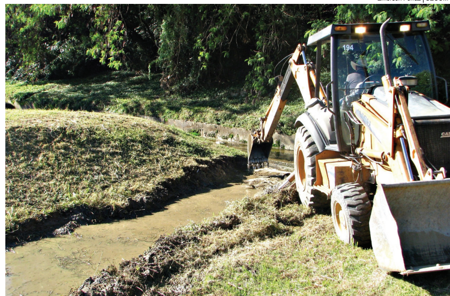
Ação consiste na limpeza e desassoreamento, incluindo a roçagem do mato e remoção de areia acumulada

tam com o apoio de máquina retroescavadeira e caminhão para o transporte do material retirado, o sistema de drenagem existente no local passará a