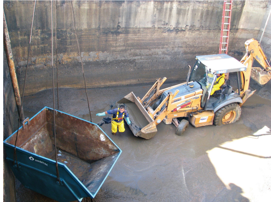
A limpeza consistiu na retirada do lodo e areia acumulados no tanque

A operação de limpeza, considerada complexa, mobilizou servidores da autarquia devidamente treinados e preparados para esse tipo de operação, principalmente no quesito segurança. O trabalho foi desenvolvido durante todo o dia, sendo concluído no final da tarde.