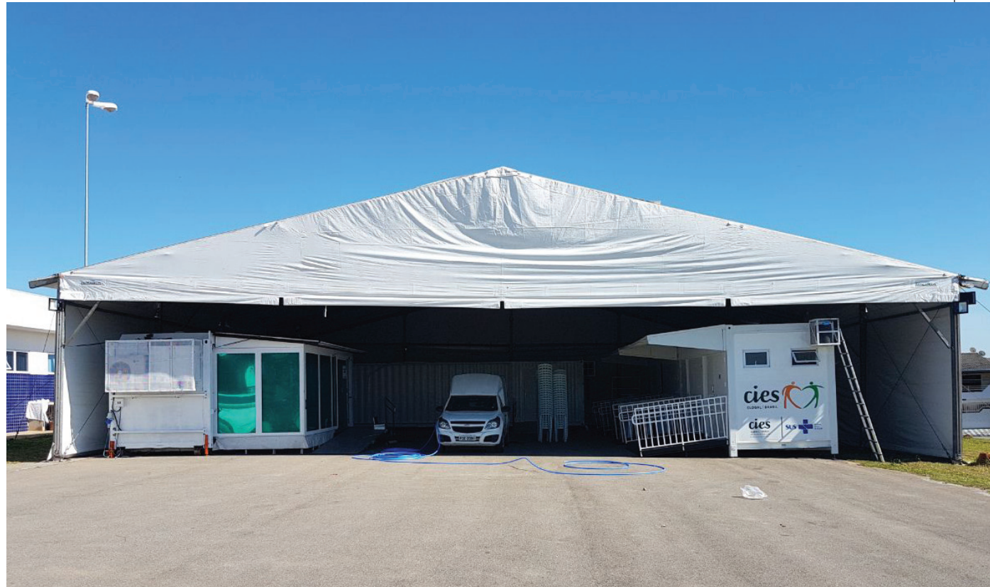
Programa foi criado para desafogar a fila de espera por atendimentos, acumulada nos últimos anos

O programa municipal Saúde em Dia dá início aos mutirões de consultas, exames e procedimentos médicos nesta segunda-feira (10). Criado para desafogar a fila de espera por esses atendimentos, acumulada nos últimos anos, o serviço descentraliza a oferta de especialidades médicas na rede municipal por meio de uma estrutura modular montada em área livre no Jardim São Guilherme, ao lado da Unidade Básica de Saúde do bairro. No local, a Secretaria da Saúde de Sorocaba informa que serão realizados cerca de 5 mil atendimentos mensais.