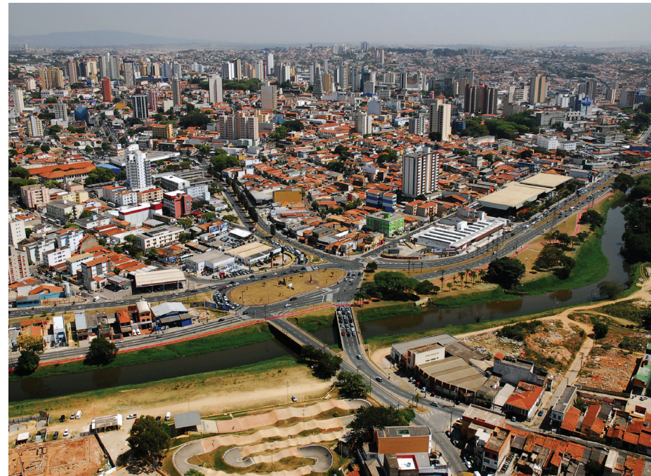
Número é o resultado de apenas sete meses do trabalho de atração de investimentos

A Secretaria de Desenvolvimento Econômico, Trabalho e Renda ressalta que oito empresas já confirmaram as suas instalações, inclusive duas delas se transferirão de outras cidades. É uma média de mais de uma empresa ao mês confirmando a sua instalação em Sorocaba em 2017. De acordo com a Secretaria de Desenvolvimento Eco-