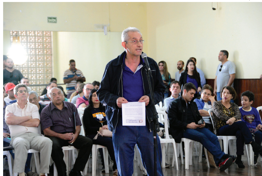
População teve microfones abertos para fazer propostas e sugestões

Conduzida pela Secretaria de Cidadania e Participação Popular (Secid), a Plenária contou com a participação de aproximadamente 200 pessoas, muitas delas representantes de organizações