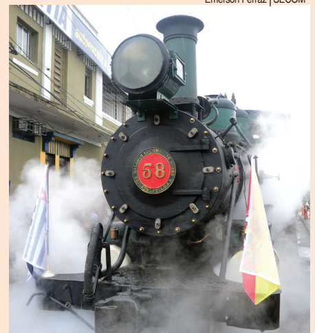
Locomotiva 58 fez um trajeto da estação Paula Souza à ponte da rua 15 de Novembro

Para que o evento desta terça-feira fosse possível, a Locomotiva 58 passou por uma série de intervenções de manutenção, numa iniciativa da Prefeitura de Sorocaba e Associação Movimento de Preservação Ferroviária do Trecho Sorocabana.