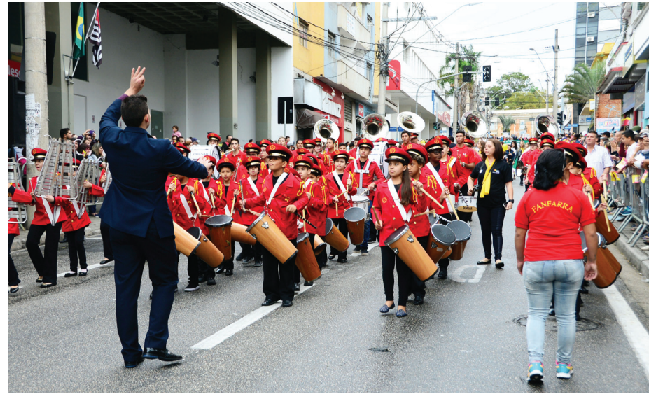
Fanfarra da escola municipal "Matheus Maylasky" foi uma das que se apresentou no desfile

O desfile cívico também foi marcado pelo retorno das tradicionais fanfar-