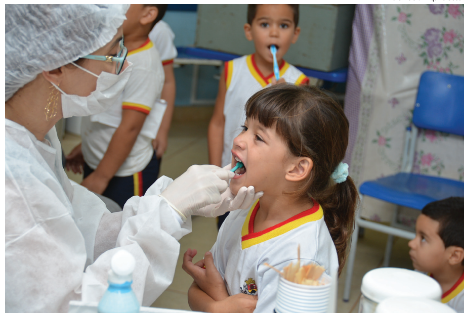
Promoção e avaliação em saúde bucal será uma das 12 ações educativas a serem abordadas

As primeiras que serão iniciadas em setembro são a avaliação antropométrica (peso e altura) e a verificação da caderneta de saúde das crianças. Para isso, equipes das unidades de saúde visitarão as escolas e verificarão pessoalmente se a vacinação de cada aluno está em dia e se a realização das triagens auditiva