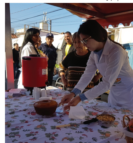
Programa é composto por ações que visam melhorar a qualidade de atendimento aos consumidores

O programa é composto por várias ações que visam melhorar a qualidade de atendimento aos consumidores, valorizar o trabalho dos profissionais das feiras livres e, é claro, comemorar o dia do feirante, celebrado na próxima sexta-feira, 25 de agosto. Vale lembrar que outra ação acontece nesta semana: a promoção do pastel de queijo, por R$ 4,00.