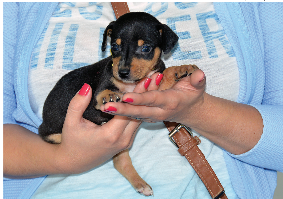
Participação é voltada a filhotes com o máximo de três meses de idade e as vagas são limitadas

A Seção de Controle Animal mantém, além das feiras, um posto permanente onde é possível adotar cães e gatos. Este serviço funciona no canil