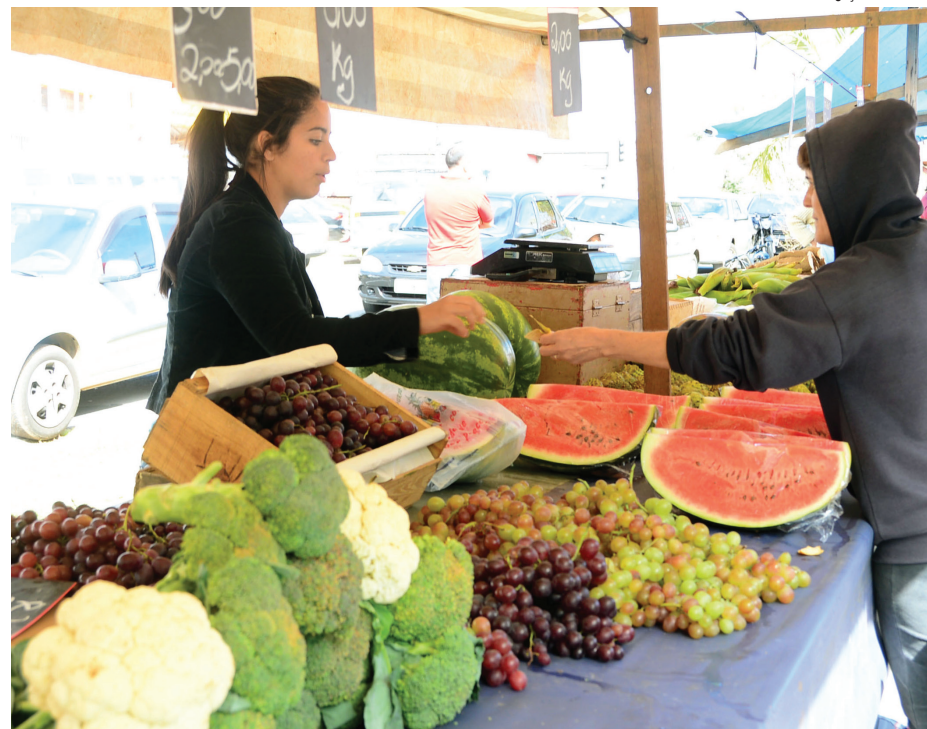
Bairro Vitória Régia pode contar agora com feira livre aos domingos

Vale ressaltar que a feira livre abre novos postos de trabalho, além de garantir conforto e comodidade ao consumidor, incentivando o sorocabano a frequentar as feiras livres. A cidade conta agora com 40 feiras livres e mais