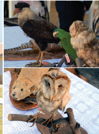
Idosos conhecem espécies de animais que ocorrem em Sorocaba

A equipe de Educação Ambiental tem por missão fomentar ações individuais e coletivas em prol da conservação do meio ambiente e da manutenção da qualidade de vida.