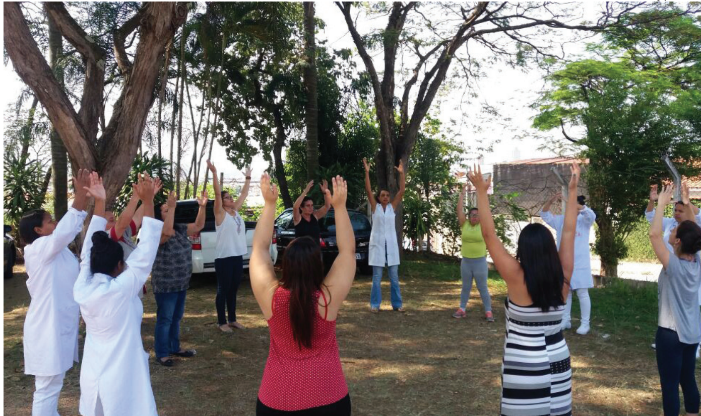
Importância das Práticas Integrativas somadas à medicina convencional

A Secretaria de Saúde, por meio da Área de Atenção Básica, está promovendo a Semana de Práticas Integrativas e Complementares em saúde, nas Unidades Básicas de Saúde de Sorocaba. A programação, que teve início dia 18, prevê atividades até sexta-feira (22).