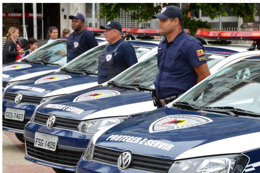
Primeira edição do projeto será no dia 18 de fevereiro (domingo), na Praça Carlos Alberto de Souza, no Campolim, a partir das 9h

Haverá também a interação direta com crianças através de um Teatro de Fantoches, com temas lúdicos e preventivos, que é apresentado pelos próprios gcms. Uma outra turma, desta vez do Grupo de Formação Cidadã da Guarda, também levará personagens infantis para a praça, divulgando o trabalho social da GCM, assim como divertindo as crianças com pintura facial e modelagem com bexigas.