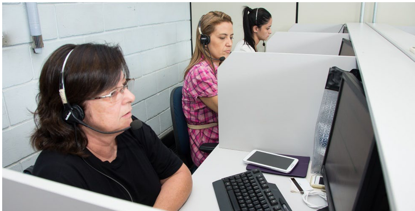
Atividades serão realizadas pelo setor da Ouvidoria da Prefeitura