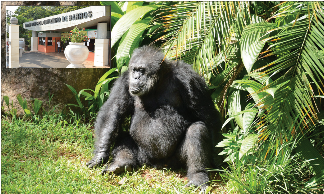
Zaneta Pereira / SECOM