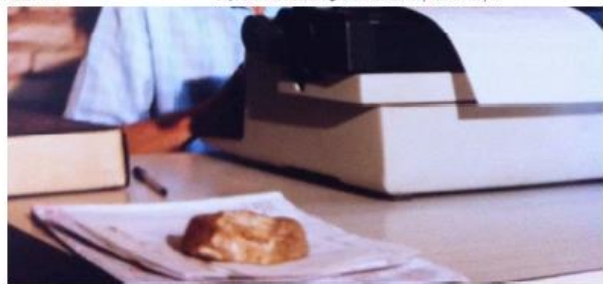
Dom Pedro Casaldáliga

Bispo Dom Pedro Casaldáliga morre aos 92 anos | Mato Grosso | G1