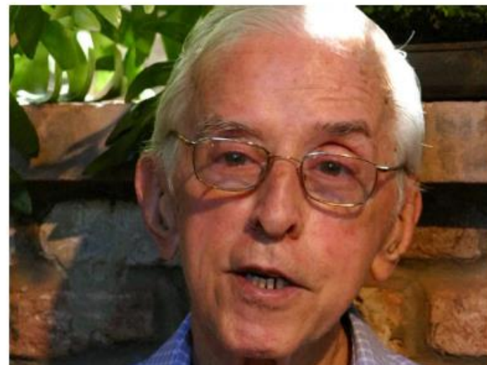
Dom Pedro Casaldáliga é bispo emérito da Prelazia de São Félix do Araguaia, em Mato Grosso.

A morte de Casaldáliga foi confirmada pela Prelazia de São Félix do Araguaia, Congregação dos Missionários Filhos do Imaculado Coração de Maria (Caretianos) e a Ordem de Santo Agostinho (Agostinianos).