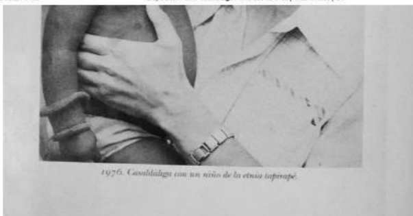
1976. Casaldáliga com um menino de la etnia isapaná.

Bispo Dom Pedro Casaldáliga morre aos 92 anos | Mato Grosso | G1