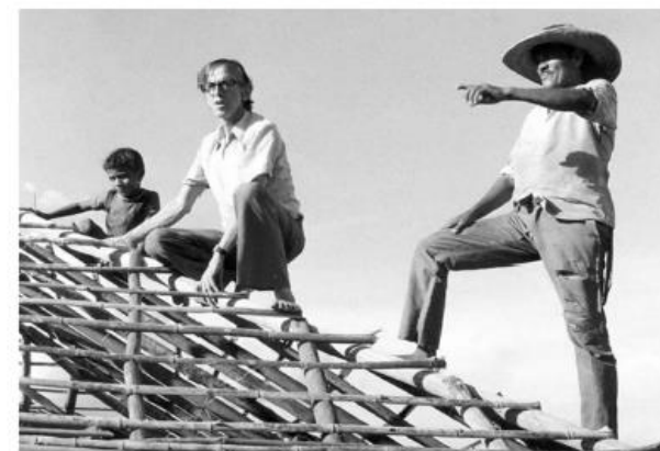
dom Pedro Casaldáliga

Em 2014, o bispo foi tema do filme biográfico "Descalço sobre a Terra Vermelha", feito por duas produtoras espanholas em parceria com a TV Brasil.