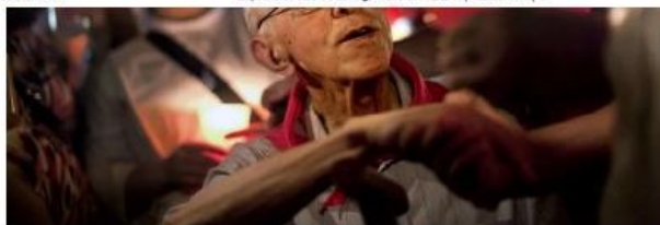
Bispo emérito de São Félix do Araguaia (MT), Dom Pedro Casaldáliga morreu nesta sábado (8) aos 92 anos

Bispo Dom Pedro Casaldáliga morre aos 92 anos | Mato Grosso | G1