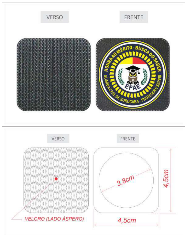
c) Medalha Busca do Saber