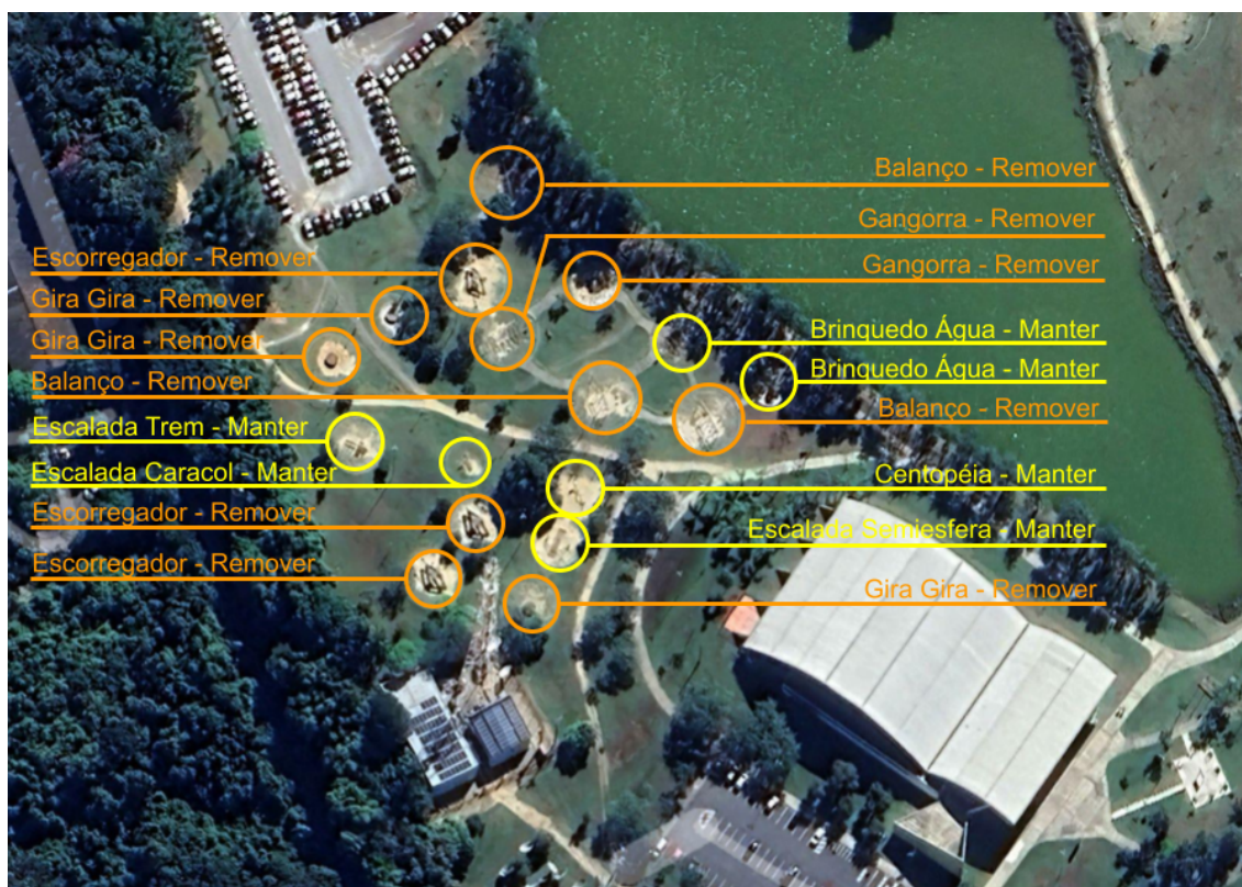
FIGURA 3: Equipamentos de Playground a serem removidos e mantidos no Parque do Paço Municipal

4.2.2.5. Os equipamentos a serem removidos, conforme indicado no Figura 3 como “remoção”, são: