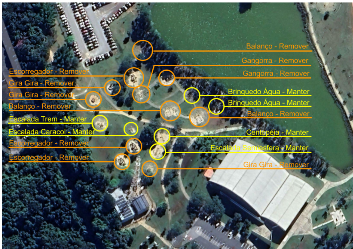
FIGURA 3: Equipamentos de Playground a serem removidos e mantidos no Parque do Paço Municipal

4.2.2.5. Os equipamentos a serem removidos, conforme indicado no Figura 3 como “remoção”, são: