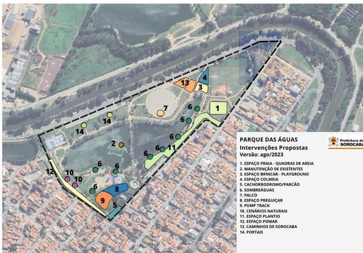
FIGURA 1: Intervenções Parque das Águas