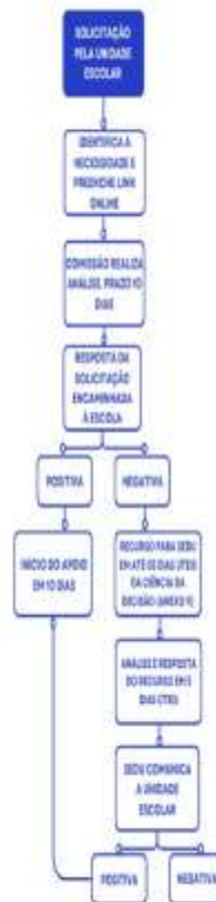
FLUXO DE SOLICITAÇÃO DE PROFISSIONAIS DE APOIO PELA UNIDADE ESCOLAR - EDUCAÇÃO ESPECIAL